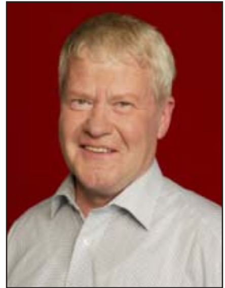
Bürgermeister Gerhard Wiesholzer