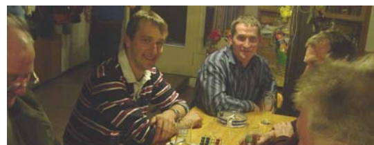
So manches Bummerl wurde gespielt..