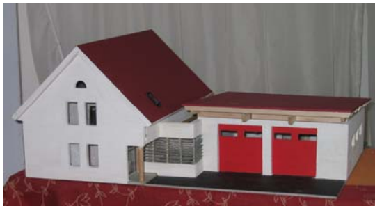
Das Modell des neuen Feuerwehrhauses in Hürth Vertreter aus Politik und Feuerwehr beim Spatenstich.