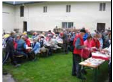
Beim Brummergut in Emling war dann Stärkung angesagt.