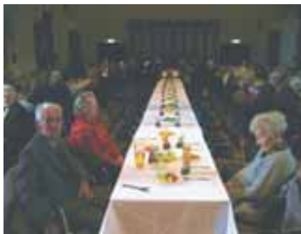
Vor dem Mahl