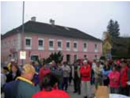
Es ging über Bergham, Gstocket, Aham und Straß Richtung Emling, die gesamte Strecke betrug ungefähr 10 km.