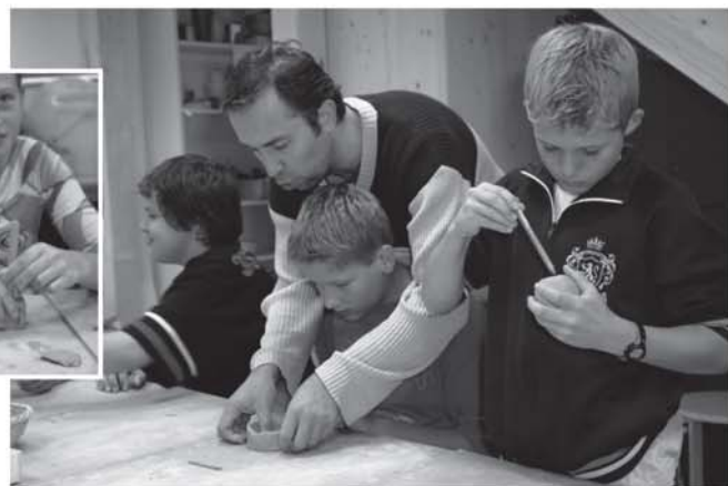
Beim Workshop im Schlossmuseum