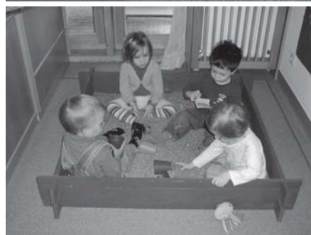
In der Weizenkiste