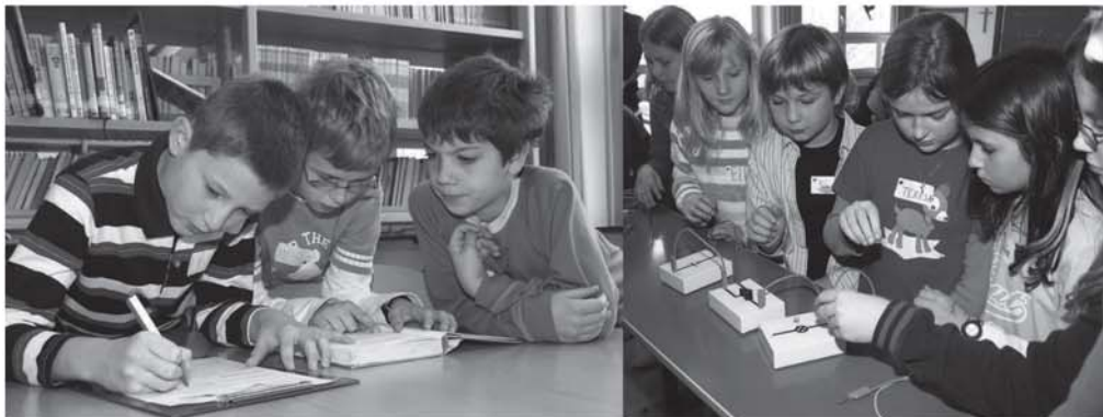
Nachhaltige Eindrücke vom „Tag der offenen Tür“ in der Hauptschule