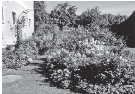
- Das schönste Bauernhaus - Herta Kremaier, Lohnharting 8