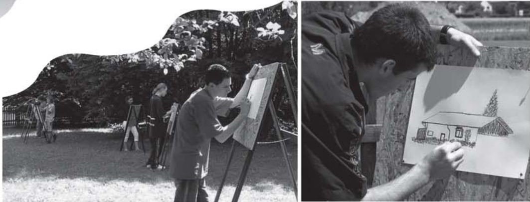
Wir zeichnen im Freien an den selbst gefertigten Staffeleien