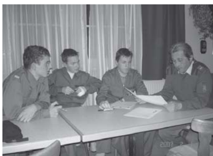
Die Jungfeuerwehrmänner nach der schriftlichen Prüfung;

Am 01. Februar wurde die Prüfung "Erprobung" im Feuerwehrhaus Schönering durchgeführt. Der positive Abschluß ist auch die Voraussetzung zur Teilnahme am Wissenstest im Bezirk. Die Prüfung bestand aus einem mündlichen und einem schriftlichen Teil. Alle Jungfeuerwehrmänner bestanden die Prüfung mit Bravour, was auch auf die gute Ausbildung durch die Jugendbetreuer HBM Natschläger Helmut und HBM Zoitl Roland und ihren Helfern hinweist.