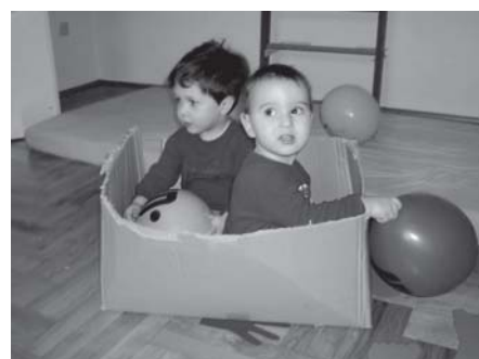
Wir spielen im Turnsaal