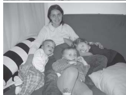
Kuscheln ist schön