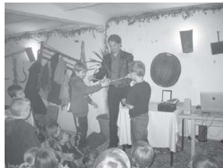
Zauberer Maguel in Aktion

Am 2.12.2006 fanden die Weihnachtsfeiern für alle Nachwuchsspieler statt. Die Jüngeren feierten beim Peherstorfer und die Älteren bei der Familie Führer in Dörnbach. Als Geschenk gab es diesmal für alle ca. 80 Jungkicker einheitliche Trainingsanzüge. Finanziert wurde das zum Teil vom Verein, von den Eltern und von einigen Sponsoren, bei denen wir uns herzlich bedanken.