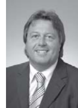
Bürgermeister LAbg. Mario Mühlböck

An Dienstagen und Donnerstagen von 9.00 - 11.00 Uhr und zusätzlich an nachstehend angeführten Terminen von 16.30 - 18.00 Uhr Telefonische Terminreservierungen sind notwendig!