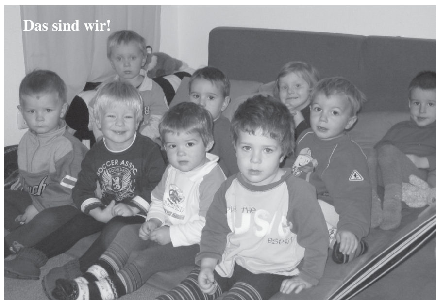
Das sind wir!