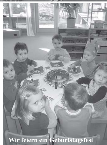
Wir feiern ein Geburtstagsfest