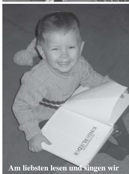
Am liebsten lesen und singen wir