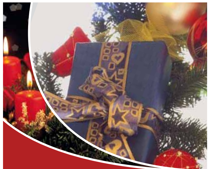
Webagentur Ingerhaußl-Boerenkamp • www.themedaxperte.at - absam